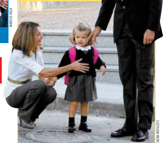
Los Príncipes de Asturias acompañaron ayer a Leonor.