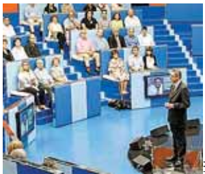
Gallardón, anoche, en La 1.

El estrés de la vuelta al trabajo, unido a la falta de luz y a la crisis, deja sin dormir a un tercio de la población. Pág. 6