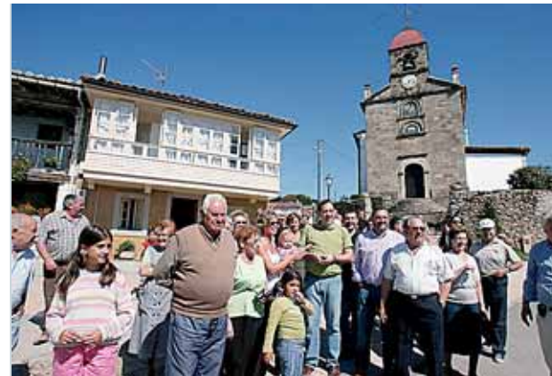
Vecinos de Torazo, en Cabranes, ayer en la plaza del pueblo.

LA COMPRAVENTA DE PISOS SE FRENA En el segundo trimestre del año se registraron 3.757 operaciones (un 18% menos que en 2007), según el Colegio de Registradores.