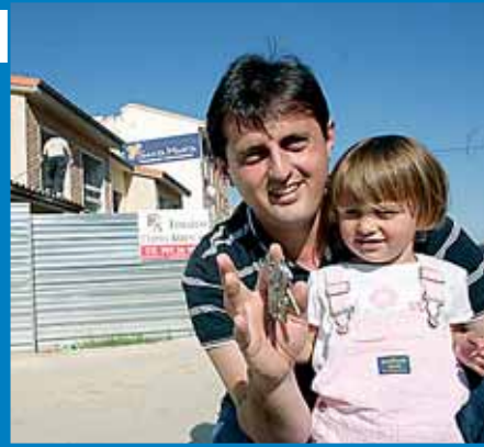
El constructor, ayer en Colloto con su hija.

Un constructor ha lanzado la 'operación cigüeña', una iniciativa que contempla descuentos de hasta un máximo de 30.000€ para las familias con hijos que adquieran uno de sus pisos. Pág. 4