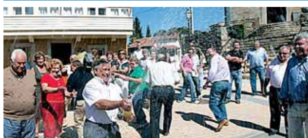
Vecinos de Torazo, localidad de Cabranes, celebran el galardón.